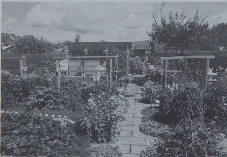
I de fleste af kolonihaverne vokser blomsterne i farvestrålende kombinationer.

- Dengang var mere end en tredjedel unge i 20'erne. De har så købt parcelhus hen ad vejen, så der er ikke så forfærdelig mange unge tilbage. Det er selvfølgelig ærgerligt, for det er aldrig sjovt kun at have én bestemt aldersklasse - ligegyldigt hvilken - koncentreret et sted. Gennemsnittet af beboerne her er nok lidt oppe i