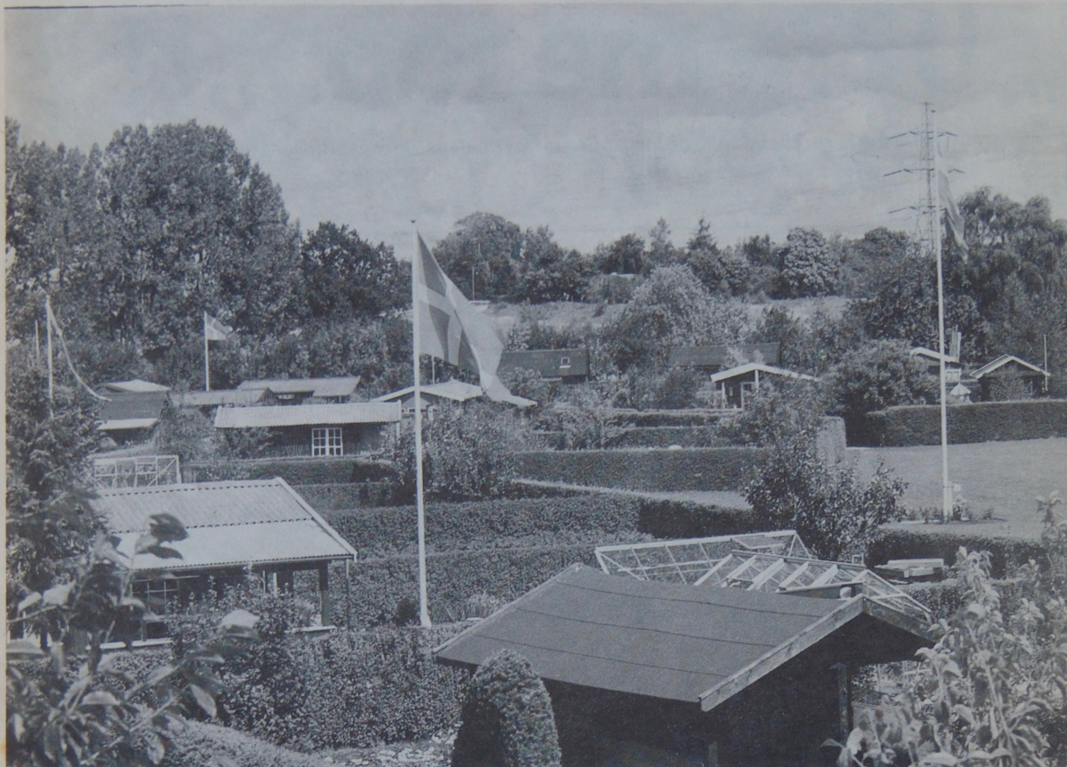
Flagstængerne rejser sig som en skov uden grene mod sommerhimlen i Haveforeningen Gurre.